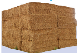
Conditionnement des fourrages, palissage vigne et horticulture