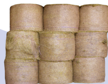
Conditionnement balles rondes